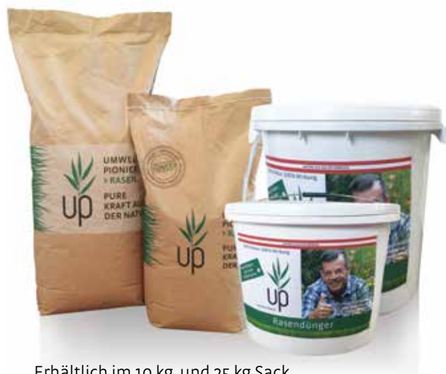
Erhältlich im 10 kg und 25 kg Sack sowie im 15 kg und 25 kg Kübel.